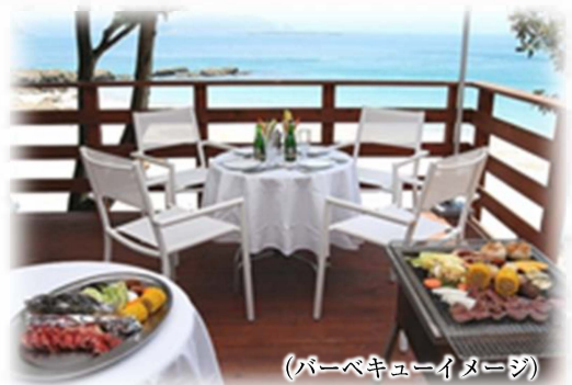
(バーベキューイメージ)

【営業期間】 夏季期間限定 (7月1日～8月31日まで) ※お電話にてお問合せ下さい。