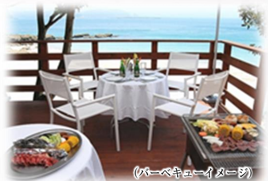
(バーベキューイメージ)